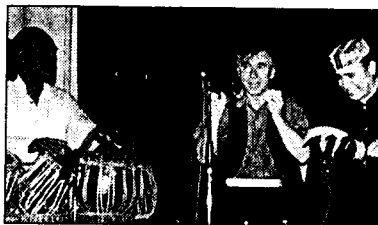
Das Trio Handcraft